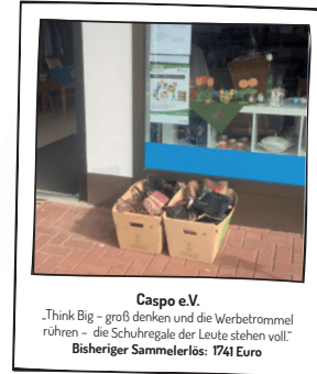
Caspo e.V. „Think Big – groß denken und die Werbetrommel rühren – die Schuhregale der Leute stehen voll.“ Bisheriger Sammelerlös: 1741 Euro