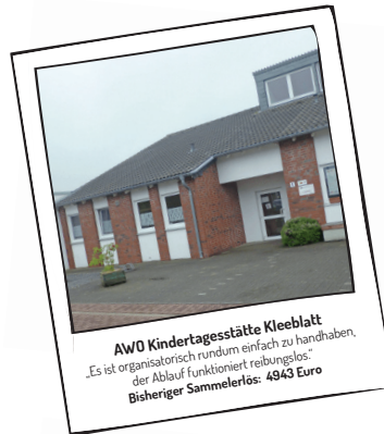
AWO Kindertagesstätte Kleeblatt „Es ist organisatorisch rundum einfach zu handhaben, der Ablauf funktioniert reibungslos.“ Bisheriger Sammelerlös: 4943 Euro