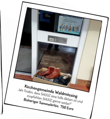
Kirchengemeinde Waldmössing „Wir finden, dass SHUUZ eine tolle Aktion ist und empfehlen SHUUZ gerne weiter!“ Bisheriger Sammelerlös: 750 Euro