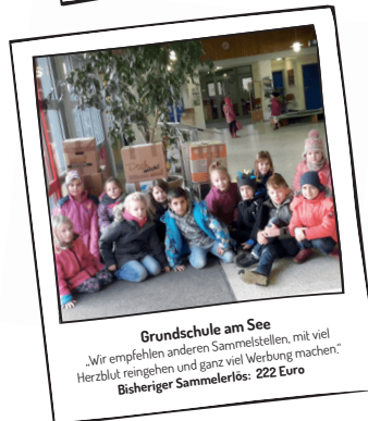
Grundschule am See „Wir empfehlen anderen Sammelstellen, mit viel Herzblut reingehen und ganz viel Werbung machen.“ Bisheriger Sammelerlös: 222 Euro