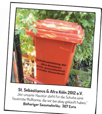
St. Sebastianus & Afra Köln 2012 e.V. „Vor unserer Haustür steht für die Schuhe eine feuerrote Mülltonne, die wir bei eBay gekauft haben.“ Bisheriger Sammelerlös: 387 Euro