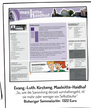
Evang.-Luth. Kircheng. Maxhütte-Haidhof „So, wie die Sammlung derzeit vorstattengeht, ist sie mehr oder weniger ein Selbstläufer.“ Bisheriger Sammelerlös: 1322 Euro